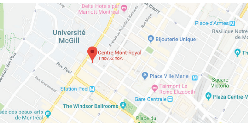
Carte du CMR